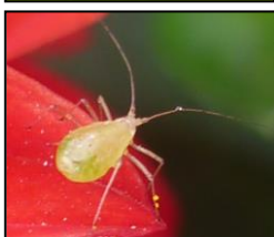
Différents pucerons retrouvés sur les dernières cultures de printemps (Flhoreal)

Les momies de pucerons parasitées sont observées sur les dernières séries en vente. Plusieurs espèces de parasitoïdes peuvent parasiter les pucerons.