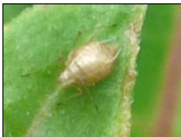
Momies de pucerons Sur cultures de fuchsia (Flhoreal)

Les momies de pucerons parasitées sont observées sur les dernières séries en vente. Plusieurs espèces de parasitoïdes peuvent parasiter les pucerons.