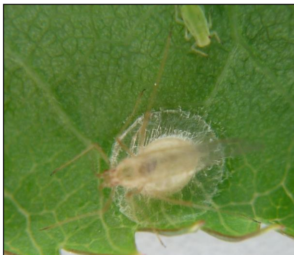
Ecto-parasitisme sur pucerons

Des traces d'ecto-parasitisme sont également retrouvées.