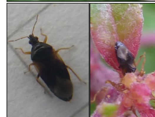
Orius majusculus sur cultures de fuchsia, de dahlia (Flhoreal)