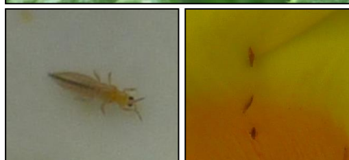
Thrips sur verveine, ostéospermum, thunbergia, dipladénia (Flhoreal)

Orius majusculus apparaît spontanément dans les cultures. Cette punaise prédatrice se retrouve sur plante entière et peuvent se nourrir de thrips mais également de pucerons, d'acariens et de petits arthropodes.